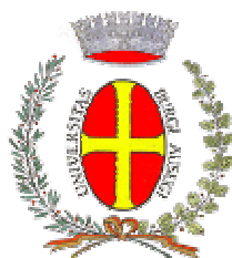
Comune di Borgo Valsugana

approvato con deliberazione consiliare n° 5 dd. 30 gennaio 1996 e successive modifiche (n.41 dd. 04.09.2001, n. 64 dd. 20.12.2005 e n. 45 dd. 29.08.2013)