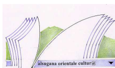
Sistema Culturale Valsugana Orientale